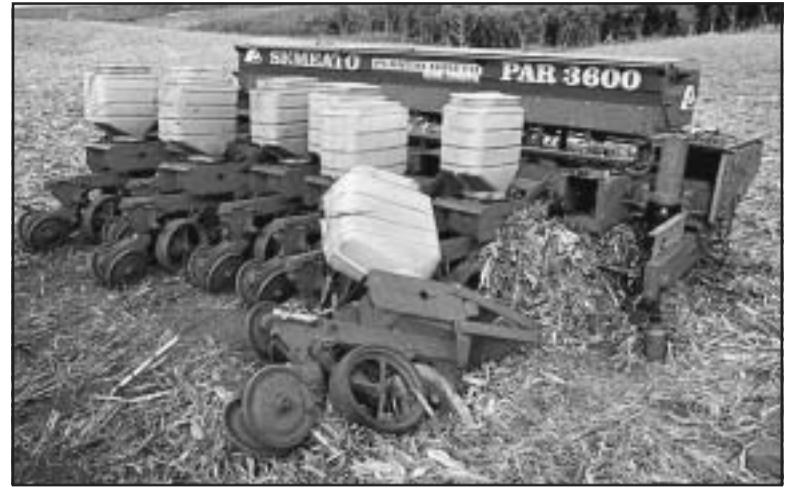
Máquinas são alvo do MST

vez desde abril do ano passado. Um grupo de mais de 200 sem-terra arrebentou a cerca que divide a fazenda com o acampamento do MST e iniciou a colheita em uma lavoura de 50 hectares de milho. Mesmo após a desocupação, houve conflitos. Pelo menos dois trabalhadores da fazenda foram agredidos e animais foram mutilados. A Brigada Militar teve de mobilizar um efetivo de mais de 200 homens para garantir a segurança no local.