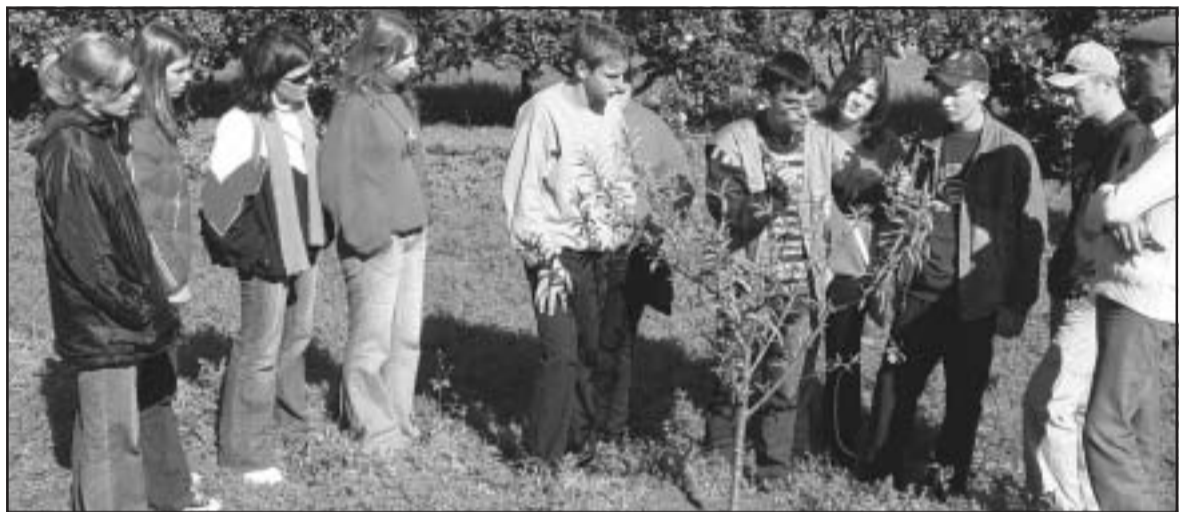
Demonstrações serão dinâmicas e levarão informações aos visitantes da feira

Os atores interpretam uma família que está enfrentando algumas dificuldades na propriedade, as quais são facilmente resolvidas ao fazer os cursos do Senar. O problema será convencer o dono da pequena propriedade a se profissionalizar. Para isso, a esposa usa algumas artimanhas que acabam envolvendo o público na trama.